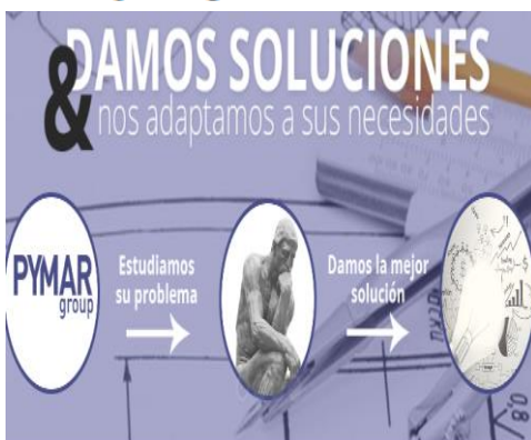
Itepacp - Grupo Pymar

El Grupo Pymar es un grupo de empresas (Pymar, Itepacp y FRG) cuyo principal objetivo es dar soluciones a sus clientes. La empresa, cuenta con un equipo humano formado en su mayoría por personal cualificado, conjuga la experiencia y la juventud y, se caracteriza, por evolucionar constantemente en la fabricación de maquinaria.