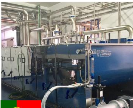
Calderería Manzano se encuentra de campaña en Portugal.

Manzano se convierte en representante exclusivo de Flottweg para aceite de oliva en España, Portugal y Marruecos